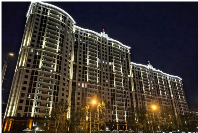
Вид на жилой дом.