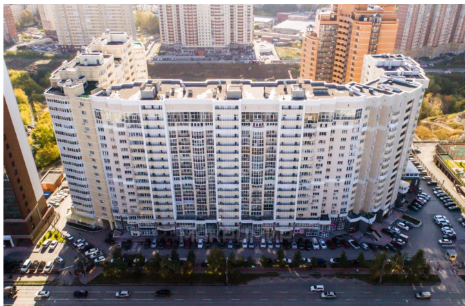
Вид на жилой дом с улицы.