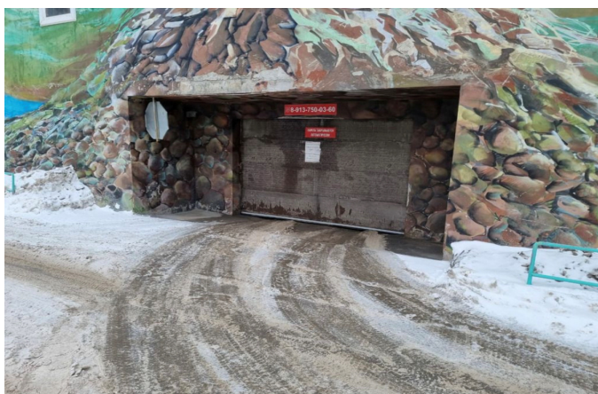
Въезд на закрытый паркинг.