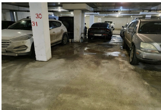
Закрытый паркинг. Вид изнутри.