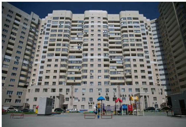
Вид на жилой дом со стороны двора.