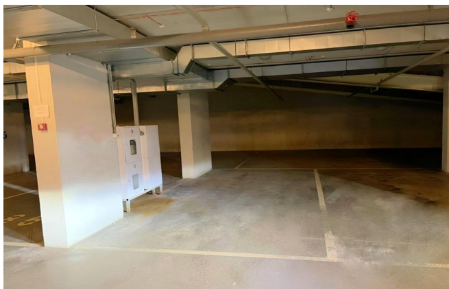
Закрытый паркинг. Вид изнутри.