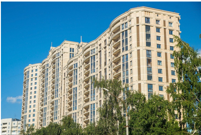
Вид на жилой дом.