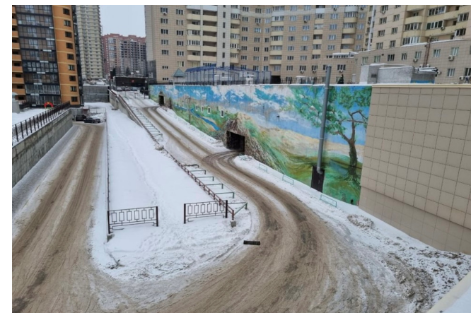
Въезд на закрытый паркинг.